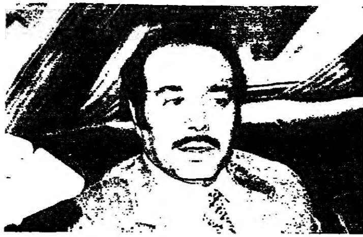
السفير الكويتي يسلي بصرجه عند حاجز الصحافة

اللجنة العربية الرباعية استكملت أمس دراسة ومناقشة اتفاقية القاهرة، والنقطة التي تم الاتفاق عليها. وأكد أعضاء اللجنة أن بياناً سيصدر عن الرئيس ياسين سركيس يوم السبت المقبل بشأن وضع الاتفاقية موضع التنفيذ.